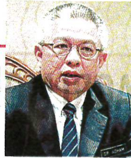
Datuk Seri Dr Adham Baba