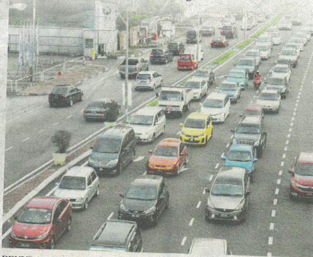
PENULARAN kes Covid-19 di Kelantan masih terkawal.

Terdahulu, tular di media sosial mengatakan Kelantan akan dikenakan PKPB bermula hari ini berikutan peningkatan kes Covid-19 di negeri itu.