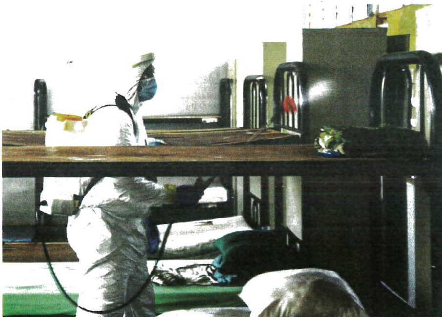
ANGGOTA bomba dari Unit Hazmat Shah Alam membantu melakukan semburan sanitasi pada ruang bilik asrama pelajar di Kolej Vokasional Kajang selepas terdapat empat kes positif Covid-19 melibatkan kakitangan kontrak pembersihan.

Mengulas mengenai peningkatan kes baharu positif Covid-19 di Lembah Klang beliau berkata, peningkatan kes itu adalah berkaitan dengan kluster tempat kerja dan tapak pembinaan dengan tahap kebolehan tinggi kerana ada pergerakan selain kurang pematuhan terhadap prosedur operasi standard (SOP).