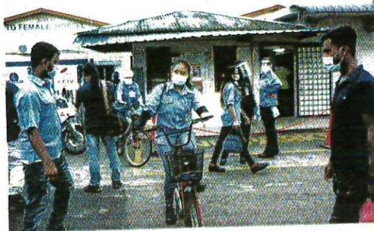
ASRAMA pekerja syarikat Top Glove di Meru, Klang dikenakan PKPD bermula hari ini sehingga 30 November ini.

Sementara itu, Ismail Sabri berkata, PKPD di Pusat Tahanan Sementara (PTS) Kota Kinabalu, Penjara Kepayan dan Kuarters