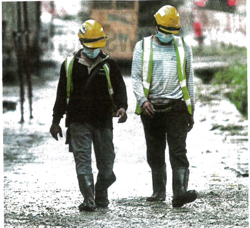
Two workers returning home from a construction site in Kuala Lumpur yesterday.

He said the CMCO had reduced the national infectivity rate from 2.2 at the beginning of the third