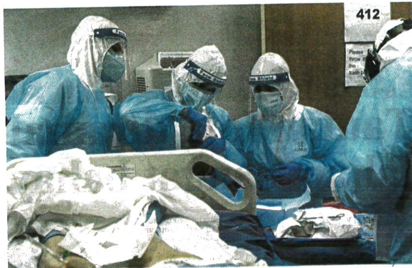
Kakitangan perubatan memeriksa pesakit COVID-19 di unit rawatan rapi di Pusat Perubatan Houston, Texas.

Jumaat lalu, Ketua Pengarah WHO, Tedros Adhanom Ghebreyesus, memberi amaran bahawa 'perjalanan masih jauh' dalam